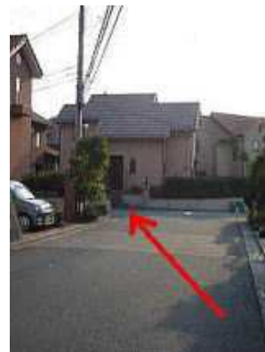
すぐに左折。その先を道なりに右に曲がります。