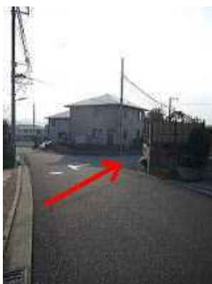
二つ目の角を右折。