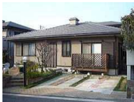
右側の2軒目の平屋です。お疲れさまでした。