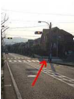
コンビニを背にして信号を右折。

【京急久里浜駅】または【JR久里浜駅】より、1番バスのりば【久20・湘南山手行】バスに乗車10分、【安房口神社前】で下車、徒歩2分です。片道180円です。